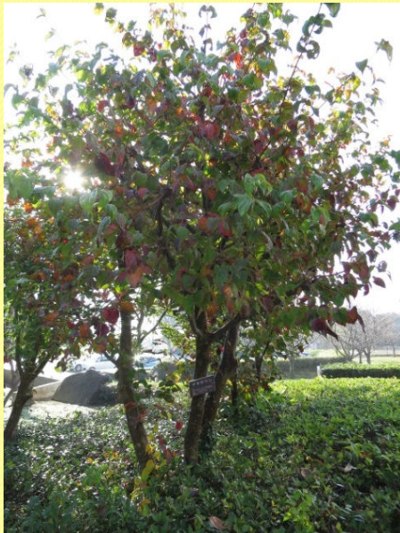
ヤマボウシ 平成27年11月5日撮影