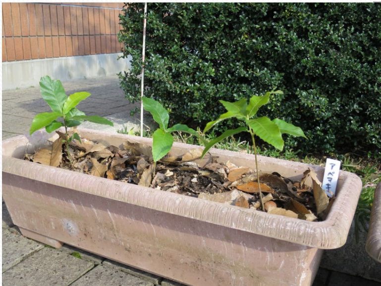
平成27年12月12日撮影 苗をプランターに植え替えてみました