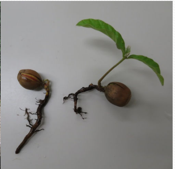
平成27年11月22日撮影 アベマキの発根と芽生え