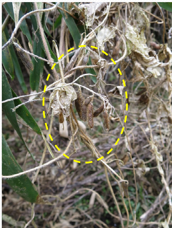
平成28年2月7日撮影 広場 ツルマメ 毛の付いたサヤがぶらさがっています。

縄文時代におけるマメの利用が今話題になっています。私たちの身近なところにも縄文人の好んだ植物がたくさん潜んでいるようです。