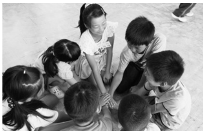
グループ活動 ～チームワークが大切～