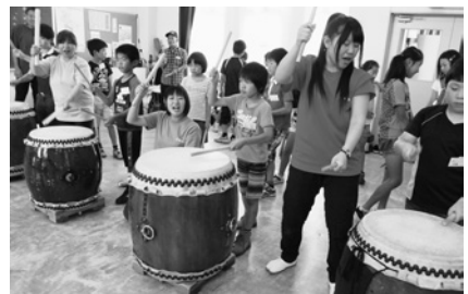
和太鼓の演奏会 ～練習の成果発表～