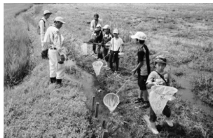
生き物探検 ～班ごとに調査開始です～