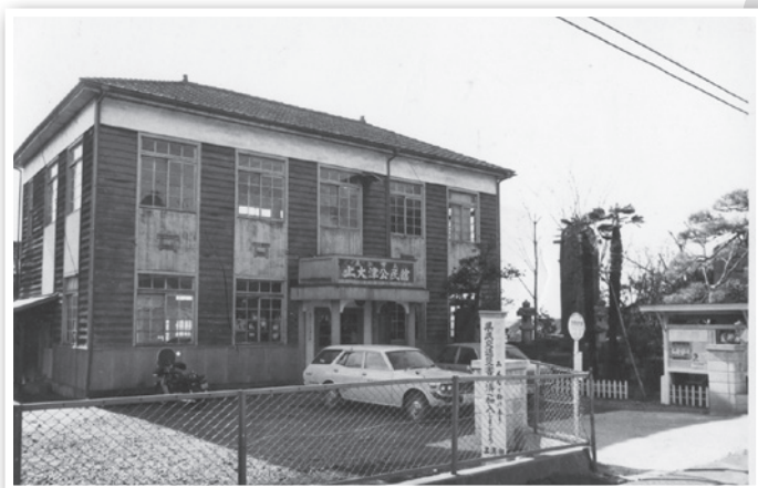
当初の公民館（旧村役場 写真はやや後のものか）

合併60周年記念事業の後に古い写真が出て来ましたので紹介します。時期・場所が不明なものも有ります。