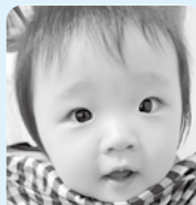
1歳おめでとう♪ 素敵なレディーになってくださいね