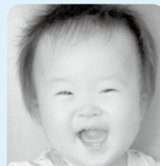
陽ちゃん笑顔でみんなも笑顔に♪ 幸せをありがとう♡