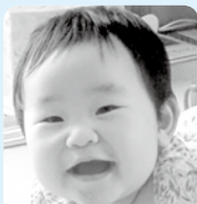
琴 大好き♡ これからもたくさん笑顔を見せてね☆