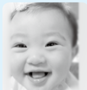
1歳おめでとう★ お兄ちゃんと仲良く元気に育ってね♡