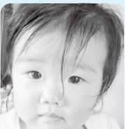
☆祝1歳☆あなたの笑顔が最高の癒し!ほらっ笑って!