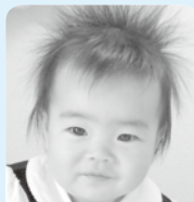
お誕生日おめでとう♡ 笑顔で元気に大きくなってね☆