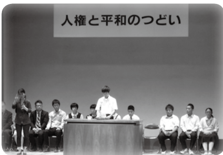
人権と平和のつどい