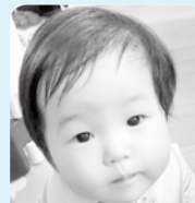
ここちゃん1歳おめでとう 笑顔で元気に育ってね♡