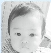
1歳おめでとう! 幸せいっぱい毎日ありがとう♡