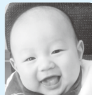
祝1歳☆ これからも沢山の可愛い笑顔を見せてね♡