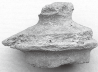
▲写真① 北陸南西部の土器(寄居遺跡)

上高津新町の寄居遺跡からは、北陸南西部地方（石川県・福井県）の土器が発見されました（写真①）。この土器は口の小さな壺の蓋ですが、つまみがつけられ表面は赤く塗られています。回りは破