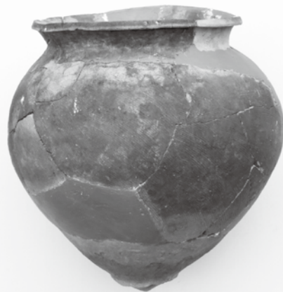
▲写真② 北陸北東部の影響を受けた土器(東谷遺跡)

霞ヶ岡町の東谷遺跡からは、口縁部の特徴が非常に良く似た甕が発見されました（写真②）。底の作りが北陸地方には無い形なので、この地方の土器を知っている人が土浦で作ったものと考えられています。口縁の部分がオリジナルを忠実に模倣していることから、北陸北東部地方からの移住者によって作られたのかもしれない。