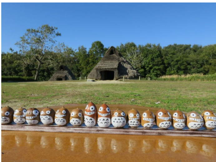
平成28年11月3日撮影 竪穴住居 広場 今年も広場のドングリにお絵かきしました。