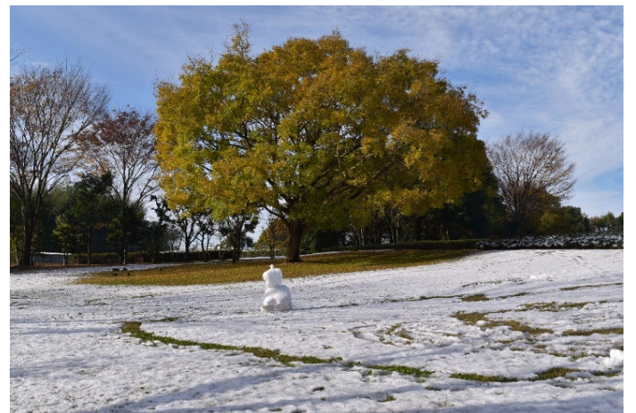
平成28年11月25日撮影 紅葉したエノキと雪だるま 広場