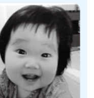
キョートな笑顔炸裂☆ まほの幸せの星が 輝きますように