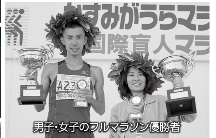
男子・女子のフルマラソン優勝者