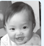
1歳☆おめでとう 幸せいっぱい♡ 元気いっぱい♡