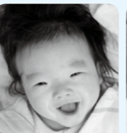
兄弟仲良く笑顔で 元気に大きくなってね！ 大好きだよ♡