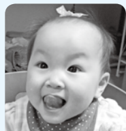
はるちゃん1歳 おめでとう♡兄妹 仲良く元気に育ってね