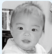
1歳おめでとう 沢山ごはんを食べて 大きくなってネ♡