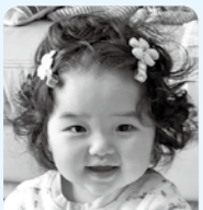
いとしさと 切なさ重ねて 早1年！