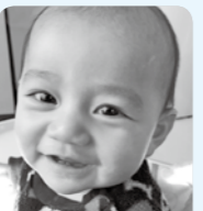
祝1歳♡いつも笑顔で たくさん食べて 丈夫に育ってね！