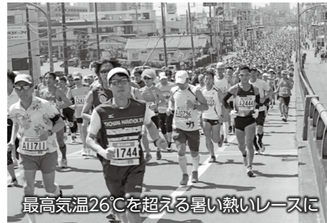
最高気温26℃を超える暑い熱いレースに