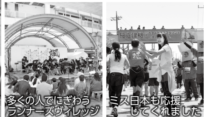
多くの人でにぎわうランナーズヴィレッジ ミス日本も応援してくれました