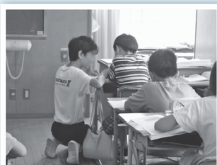
【中学生による小学生への夏休みの学習支援】

8つの中学校区ごとに児童生徒の交流、学習や生活の決まりを各中学校区で統一、小学校での教科担任制導入