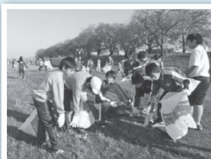
【小中合同クリーン作戦】