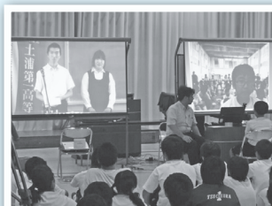
【小中高間テレビ会議】