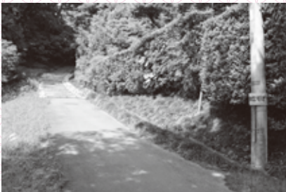
▲鎌倉坂(真鍋四丁目)

では、幅6〜7m以上の硬化面が両側に側溝をもった形で発見される例が多く、地形上も大規模に台地を切り通して道を作っているものが少なくありません。県内の発掘調査事例を見る限り、現時点で幅7m以上の硬化面を持ち、両側側溝と掘り込み事業を有する報告例は現在までのところ報告されていません。