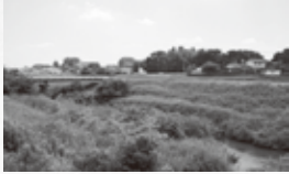
▲花室川にかかる源兵衛橋 (永国・中)