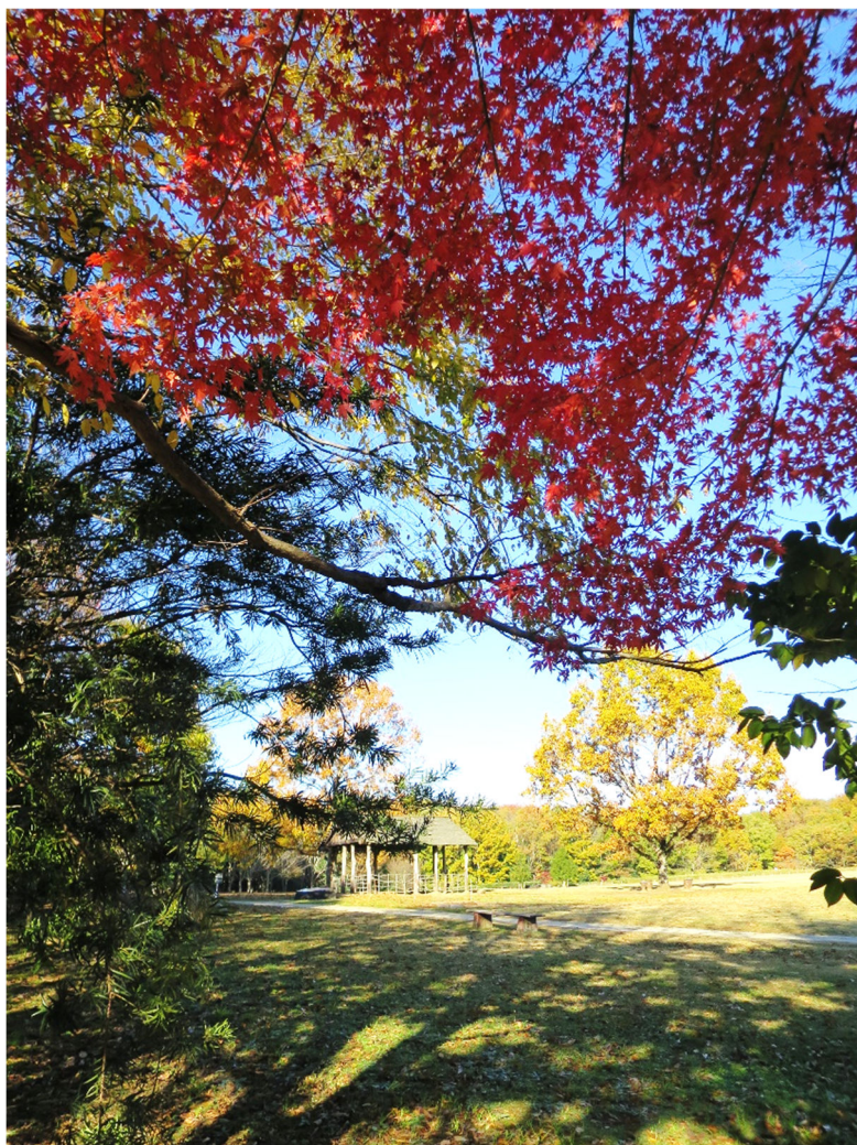
イロハモミジと掘立柱建物 平成29年11月28日撮影 広場