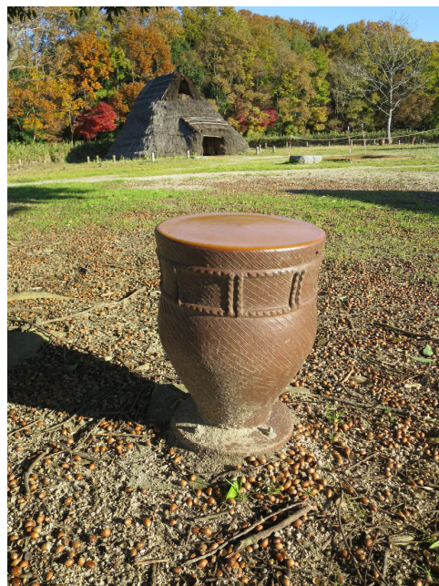
シラカシのどんぐり 平成29年11月28日撮影 広場 竪穴住居のそば、土器型ベンチのまわり にはたくさんのどんぐりが落ちています。