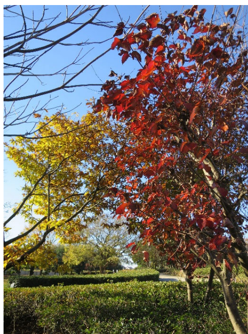
ヤマボウシとクリの紅葉 平成29年11月28日撮影 広場