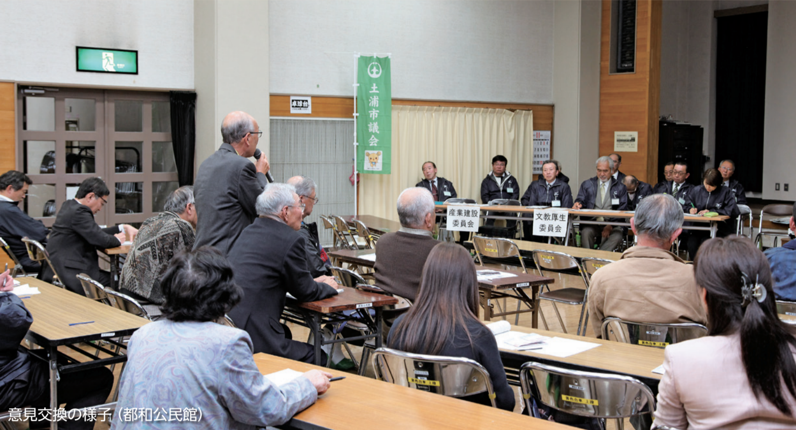
意見交換の様子(都和公民館)

土浦市議会では、市民の皆さまに開かれた議会とするため、議会報告会を開催いたします。