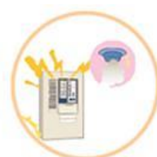
③自動火災報知設備

上記設備が設置されていないもの又は設置されていても、維持管理が不適切で主たる機能が喪失している場合です。