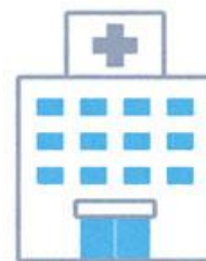
病院・福祉施設等