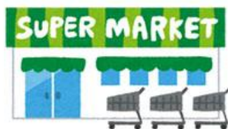
飲食店・物品販売店

飲食店・物品販売店・ホテルなど不特定多数の方が利用する建物や、病院・福祉施設等の一人で避難することが難しい方が利用する建物です。