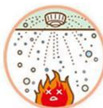
②スプリンクラー設備