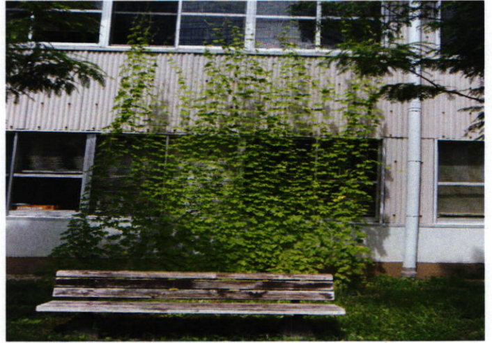
製造事務所前のグリーンカーテン