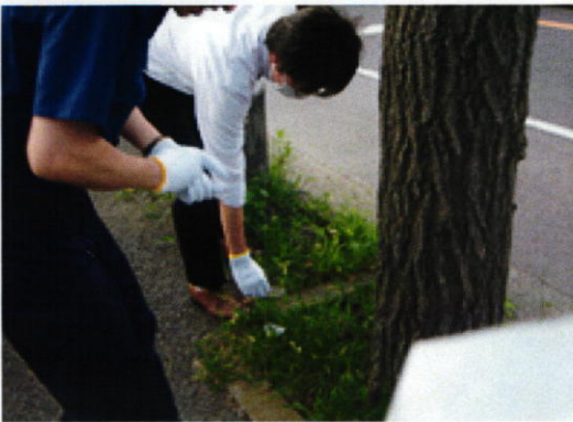
工場周辺の清掃活動