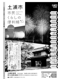
▲平成30年度版 市民くらしの便利帳