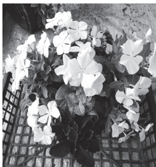
【季節の花の寄せ植え】