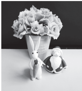
【サンタクロースのパンド】

①1/9(水)、②1/10(木)、③1/11(金) 時①9:30~12:30、②9:30~10:30、③10:00~12:30 講 手作り食品研究会 添加物不使用! 国産大豆で本格的な味噌と豆腐づくり。定15人 ¥5000円 ※農村環境改善センター(永井本郷入会地)現地集合解散