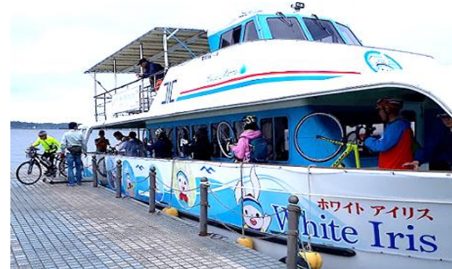
霞ヶ浦広域サイクルーズ