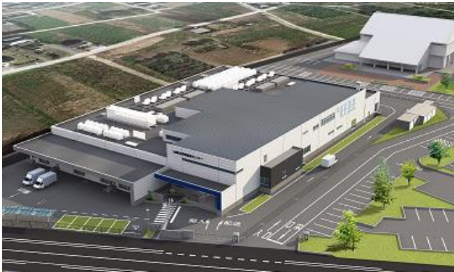
新学校給食センター (イメージ図)