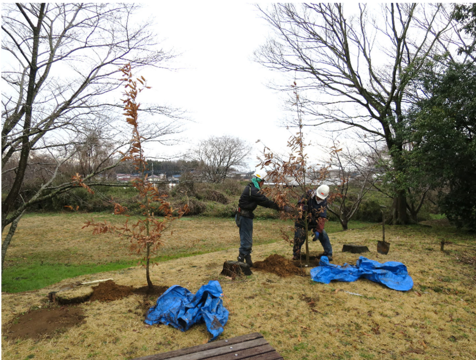
アベマキの植え替え 令和2年3月5日撮影 広場