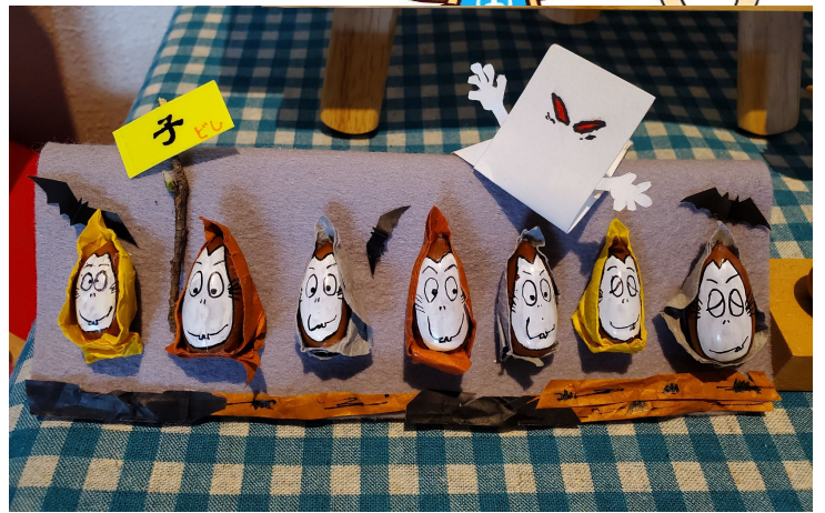
資料館入口 今年は子年ですので、マテバシイを使って書いてみました。