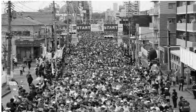
第30回記念大会 かすみがうらマラソン