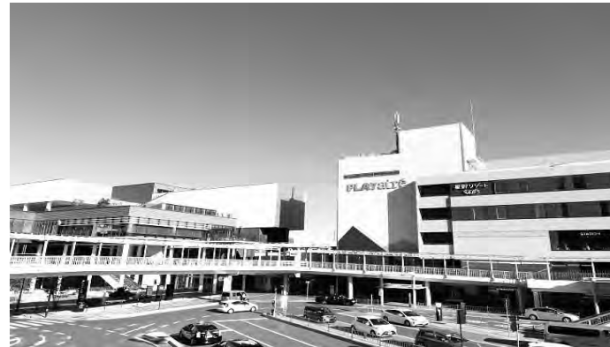
未来に向かう土浦駅前