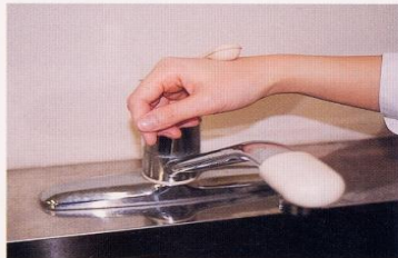
7. 水道の栓を止めるときは、手首か肘で止める。できないときは、ペーパータオルを使用して止める