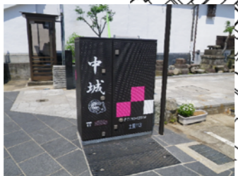
地上器へのペインティング