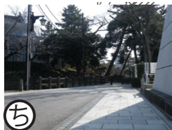
博物館脇 平成18年度事業