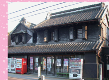
矢口家住宅 茨城県指定文化財