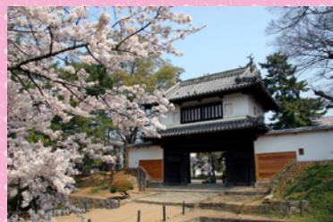
亀城公園（土浦城址） 茨城県指定史跡