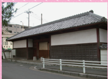
郁文館（藩校）正門 土浦市指定文化財