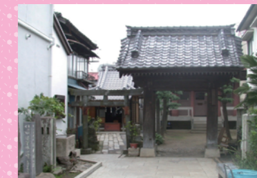
琴平神社・不動院