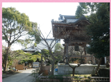
等覚寺（銅鐘 国指定重文）