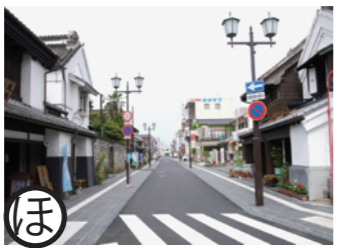
中城通り 平成18～20年度事業