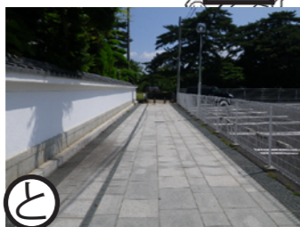
本妙寺脇 平成18年度事業