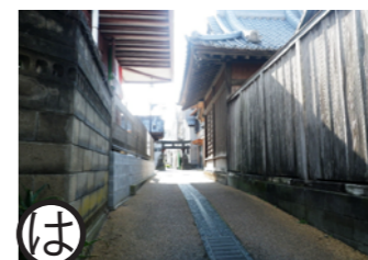
大徳脇 平成14年度事業