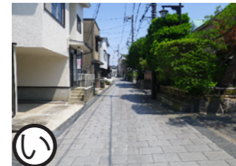
裁判所前 平成13年度事業