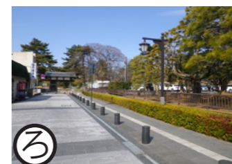
琴平通り 平成14年度事業 （一部20年度）