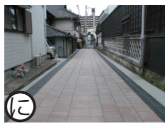
天神通り 平成15年度事業