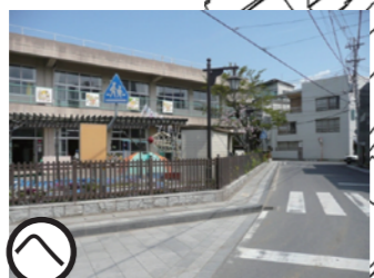
内西通り 平成16年度事業