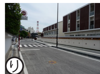
たまき通り 平成26年度事業 （土小脇含む）