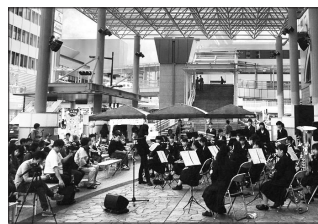
▲「つちうらが好き!文化祭 ライブ&マルシェ」

市で進める協働事業のひとつに「協働のまちづくりファンド(ソフト)事業」があります。これは、市が抱える地域課題を解決するために、市民団体が行う活動に対して資金の支援をするものです。令和元年度は、音楽でまちのにぎわいを創りたい、福祉を充実させたい、自転車のまちをPRしたいなどの目的をもった4団体が事業を実施し、協働のまちづくりに貢献していただいています。