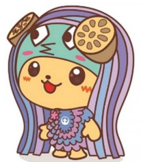
土浦市イメージキャラクターつちまる（アマビエVer.）

住み慣れた地域で、いつまでも自分らしく過ごせるように、シルバーリハビリ体操指導士となって、仲間と一緒に活動してみませんか！