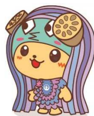
土浦市イメージキャラクターつちまる（アマビエVer.）

住み慣れた地域で、いつまでも自分らしく過ごせるように、シルバーリハビリ体操指導士となって、仲間と一緒に活動してみませんか！