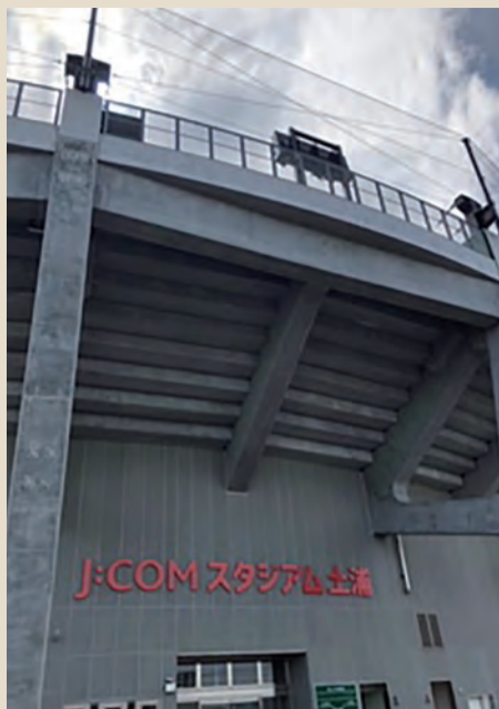
J・COMスタジアム土浦 (川口運動公園野球場)

場外へのファウルボール飛び出しを減らすことにより、歩行者や駐車場利用者等の安全確保を図り、より安全に施設を利用できる環境の整備を図ることを目的に、J・COMスタジアム土浦(川口運動公園野球場)のスタンドに防球ネットを設置したものです。