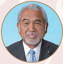
土浦市右舂 1681-98 ☎ 029-842-0119