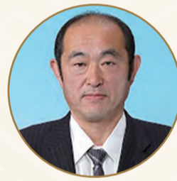
土浦市藤沢 3434-5 ☎ 090-8487-7812