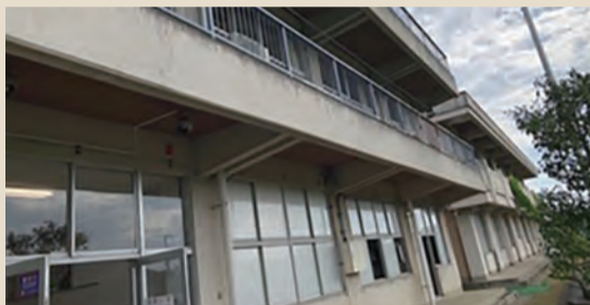
旧穴塚小学校校舎