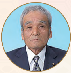
土浦市藤沢 1467 ☎ 029-862-2659