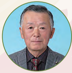
土浦市中高津一丁目 3-9 ☎ 029-824-8073