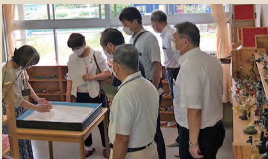
教育相談室の様子