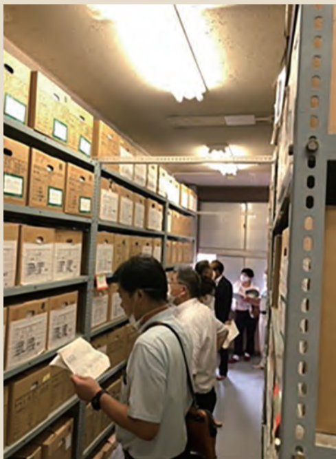
公文書書庫の様子

旧校舎を、容量がひっ迫していた市の公文書の書庫として、また、土浦市教育相談室を設けて利活用しています。