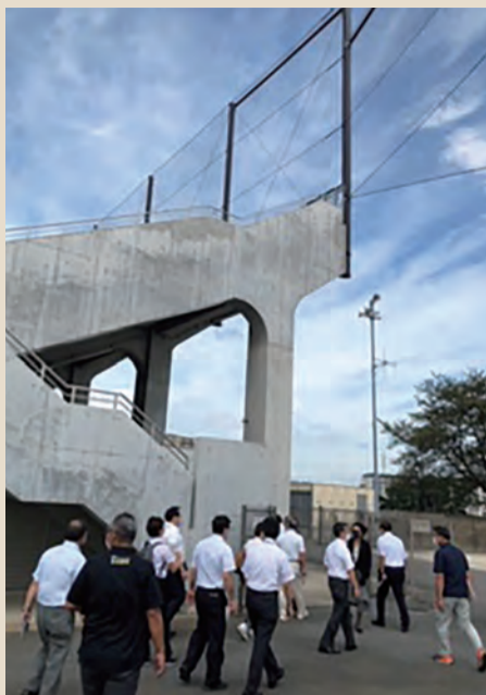
現地視察の様子 (防球ネット：写真上部)