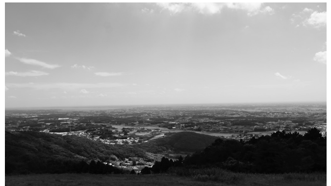
朝日峠からの眺め

時①10:00～11:30②9:00～14:00講土浦市観光ボランティア協会内身近な山にハイキングに行こう!①講義②朝日峠までハイキング(公民館集合。バスで現地まで送迎。)定15人持弁当、飲み物¥300円