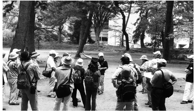
ローカルヒストリーウォーキングの様子

時8:30～12:30講土浦市観光ボランティアガイド内土浦は古道の宝庫です。今回は主として豊かに残る水戸街道遺産を訪ね歩きます。各日8～9km程度。定25人持タオル、飲み物、歩きやすい服装 ¥300円