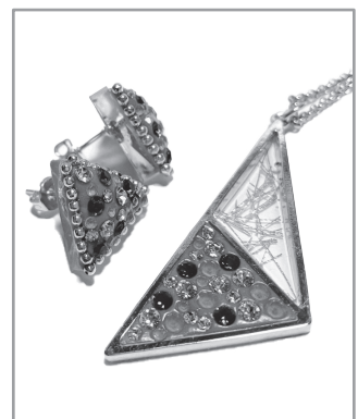
グルーデコ®のアクセサリー