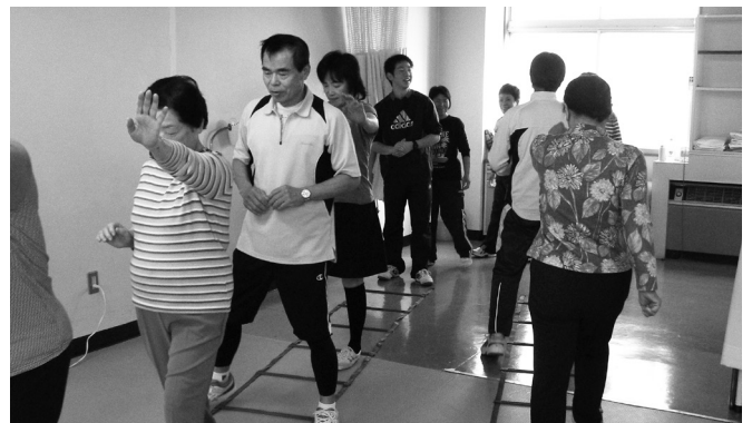
ラダーを使った運動

時13:30～15:00講坂本充内ボールとラダーを使った運動と、身体を動かしながらの脳トレを体験します。定10人持筆記用具、運動のできる服装¥100円