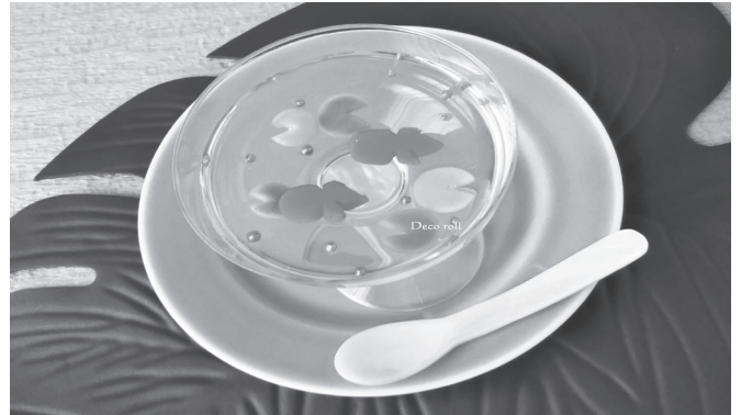
ひんやりデコゼリー