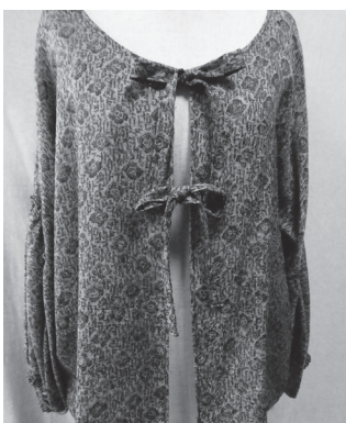
着物をリメイクしたブラウス