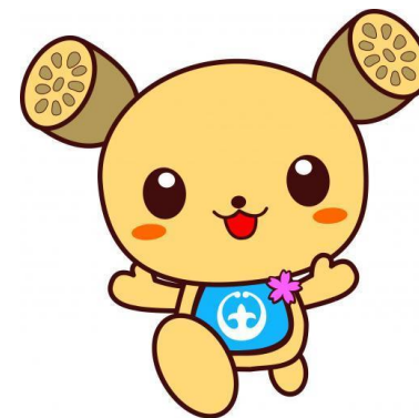
土浦市イメージキャラクター つちまる

児童発達支援センターとは 日常生活における基本的な動作の指導や集団生活への 適応訓練等を行う児童福祉法に基づく施設です。