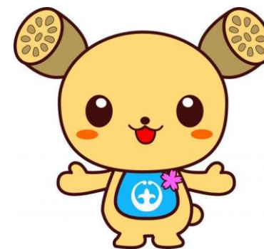
土浦市イメージキャラクター つちまる