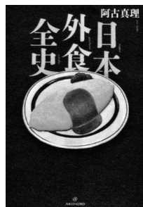
日本外食全史 (食生活)

江戸の昔から、日本人の胃袋と心を満たし、人と人のつながりを生み出してきた外食。高級フレンチ、寿司、天ぷらからファミレス、カレー、ラーメン、アジア飯まで、あらゆるジャンルの誕生や流行の変遷を紹介する。(阿古真理/著)