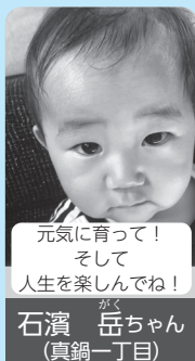
元気に育って! そして人生を楽しんでね!