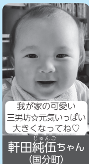
我が家の可愛い三男坊☆元気いっぱい大きくなってね♡