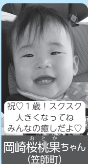
祝♡1歳! スクスク大きくなってね みんなの癒しだよ♡