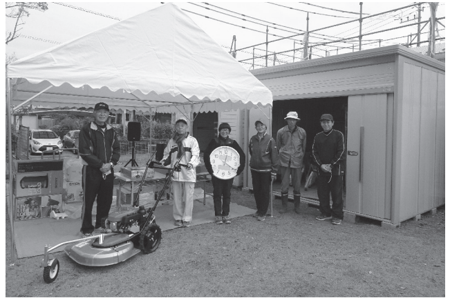
烏山二丁目町内会で整備した公民館備品

烏山二丁目町内会が、令和3年度コミュニティ助成(宝くじ助成)を受けて、地域コミュニティ活動のために公民館備品の整備を行いました。