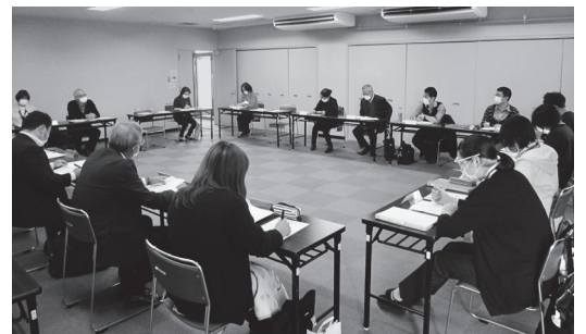
ケース検討会議の様子