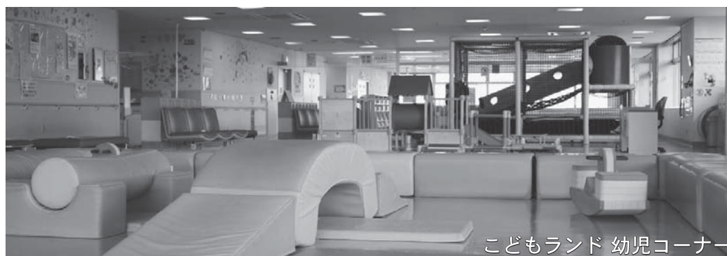
こどもランド 幼児コーナー