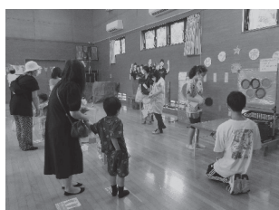
ポプラ児童館デー