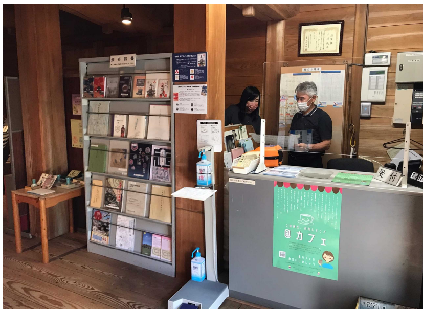
東櫓の受付周辺(2022年7月10日撮影)

土浦城東櫓は平成10(1998)年に復元した建物で、博物館の付属展示館です。本館の受付業務や一部書籍等の販売も行えるよう、引っ越し作業をしました。