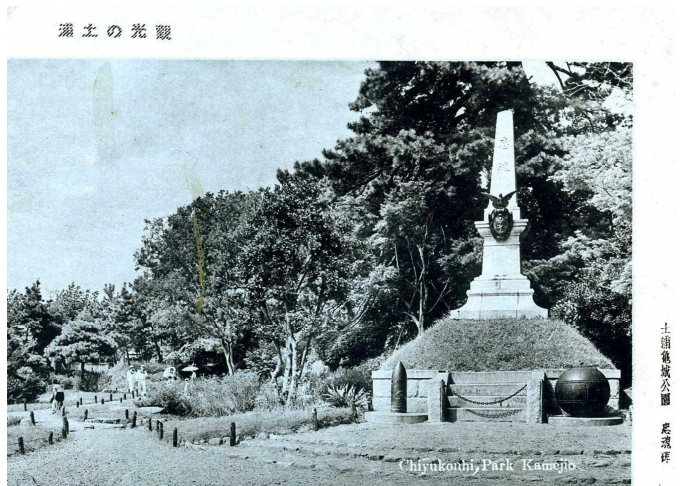
写真2 絵葉書「観光の土浦 土浦亀城公園 忠魂碑」 昭和10年以降 当館所蔵