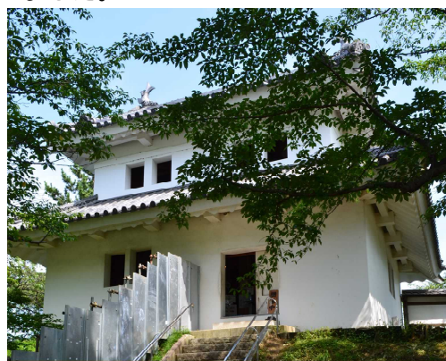
東櫓外観(2022年7月21日撮影)

土浦城東櫓は平成10(1998)年に復元した建物で、博物館の付属展示館です。本館の受付業務や一部書籍等の販売も行えるよう、引っ越し作業をしました。