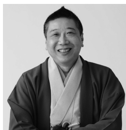
【真打】春風亭柳雀 令和4年5月真打昇進

日時 11月23日(水) 午後2時 (開場は午後1時30分から) 場所 クラフトシビックホール土浦(市民会館) 料金 1000円(全席自由) ※未就学児の入場はご遠慮ください。 ※車いす席を希望する方はご連絡ください。 チケット販売期間 9月17日(土)から チケット販売場所 クラフトシビックホール土浦 問合せ クラフトシビックホール土浦 (☎822-8891)※月曜休館