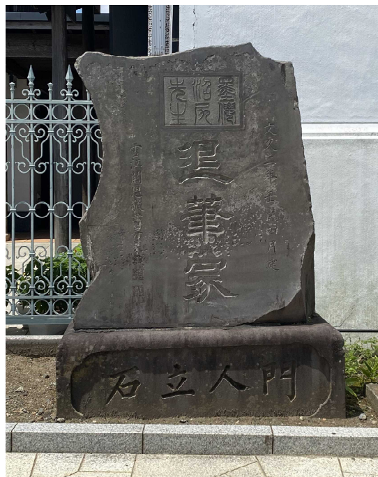
写真1 退筆塚 市指定文化財