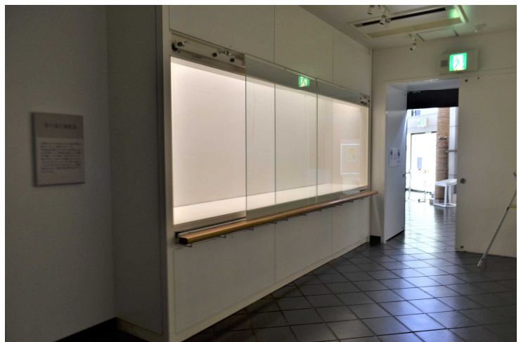
展示室1 大名家の文化コーナー(8月5日撮影)