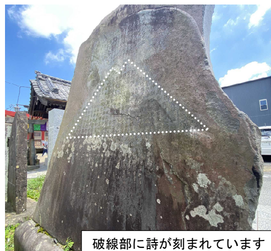
破線部に詩が刻まれています