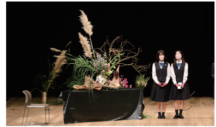
土浦第一高等学校 華道部の作品