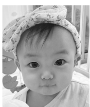
1歳おめでとう♡ 元気にすくすく 育ってね!