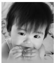
1歳おめでとう いつもニコニコ 連ちゃん大好きだよ☆