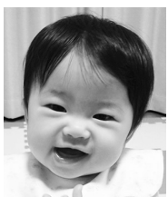
幸せをありがとう 兄妹仲良く元気に 大きくなってね♡