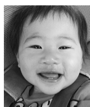
1歳おめでとう♡ これからずっと 笑顔をお忘れずに!