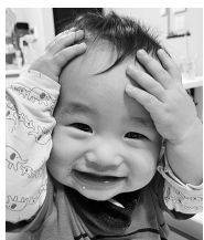
のんびり屋さんだね☆ 楽しく大きくなってね♡