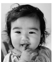
1歳おめでとう! 生まれてきてくれて ありがとう♡