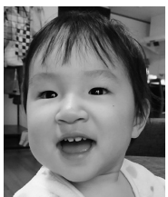
毎日笑顔と感動を ありがとう♡ 大好きだよ