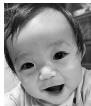
1歳誕生日 おめでとう♡ 君の笑顔は世界ー!