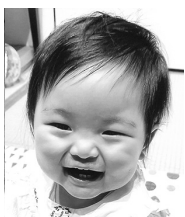
1歳おめでとう☆ 元気に大きくなってね♡ 大好き♡