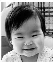
♡1歳おめでとう♡ 可愛い笑顔が 大好きだよ!!