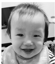
1歳おめでとう♡ 毎日癒しをありがとう♡ 大好き♡