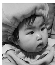
1歳おめでとう 元気にすくすくと 育ってね☆