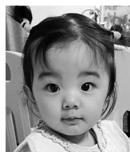
毎日幸せをありがとう! みんなで沢山 笑おうね☆