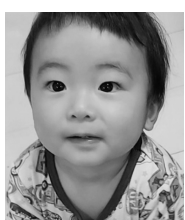
6姉妹の末っ子! 強い!強い! 1歳おめでとうー!