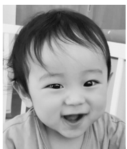
1歳おめでとう 健康で元気に育ってね だいすきだよ♡