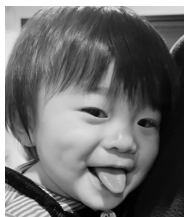
祝♡1歳 いつもかわいい笑顔が ありがとう♡