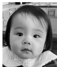
陽菜が生まれて きてくれて 本当に幸せだよ♡大好き