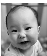
1歳おめでとう! 食べて笑って 元気に育ってね♡