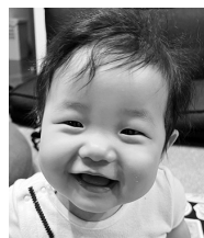
祝1歳!ねえねと一緒に 楽しく元気に 育ってね♡