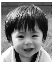
☆祝1歳!☆ たくさん笑顔で 元気よく過ごしてね!