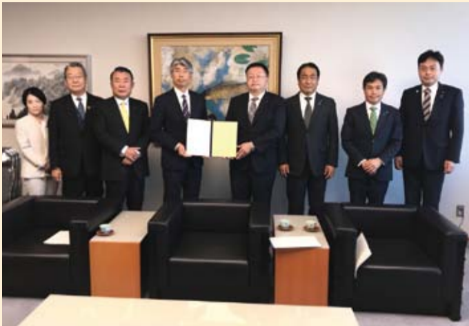
左から高橋直子県議会議員、八島功男県議会議員、伊沢勝徳県議会議長、横山征成副知事、小坂博議長、塚原圭二副議長、勝田達也委員長、矢口勝雄副委員長