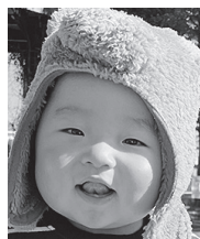
1歳おめでとう! これからも 元気に育ってね♪