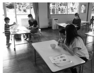
親子ハンドメイド