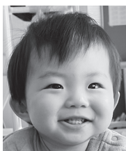
☆祝1歳☆ これからも沢山の人を 幸せにしてね♡