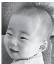
笑顔の可愛い ほまちゃん♡ 元気に大きくなってね!