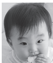
1歳おめでとう! 毎日幸せだよ! 元気に育ってね☆