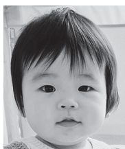
1歳おめでとう♡ 産まれてきてくれて ありがとう♡