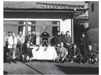
真鍋四丁目町内会 お祭りのコミュニティ活動備品