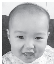
♪祝1歳♪ すくすく元気に 大きくなってね!