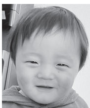
祝1歳♡ 兄弟仲良くみんな 楽しく過ごそうね☆