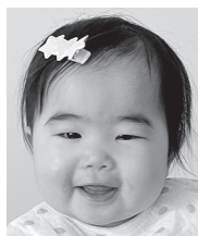
1歳おめでとう! ゆず大好き♡ にいと仲良くね♪