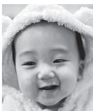
1歳おめでとう☆ 笑顔溢れ遅く 育ってね♡