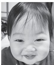
ぶにぶにほっぺの たいちゃん♡ 癒しをありがとう♡