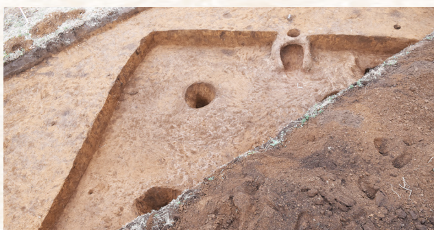
古墳時代の竪穴建物(右舂:形部遺跡)