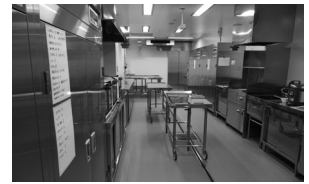
アレルギー対応調理室