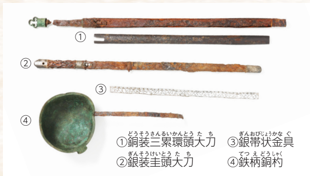
国指定文化財「茨城県武者塚古墳出土品」