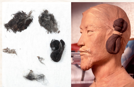
左: 国指定文化財 茨城県武者塚古墳出土「美豆良」 右: 復元された美豆良