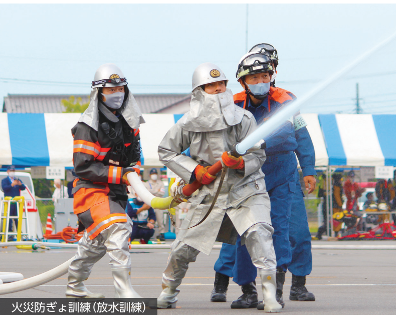
火災防ぎょ訓練(放水訓練)