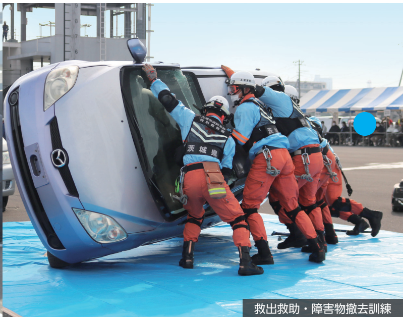
救出救助・障害物撤去訓練