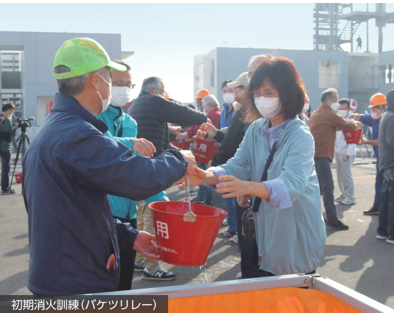
初期消火訓練(バケツリレー)