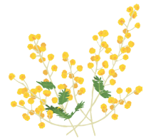
国際女性デーのシンボル「ミモザの花」

国際女性デーをきっかけに、改めて女性の活躍の機運を盛り立て、男女平等への課題を考えてみませんか。