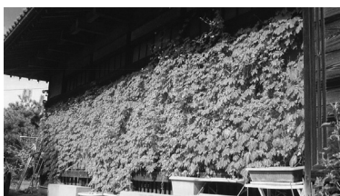
第10回 グリーンカーテン コンテスト 家庭部門最優秀賞