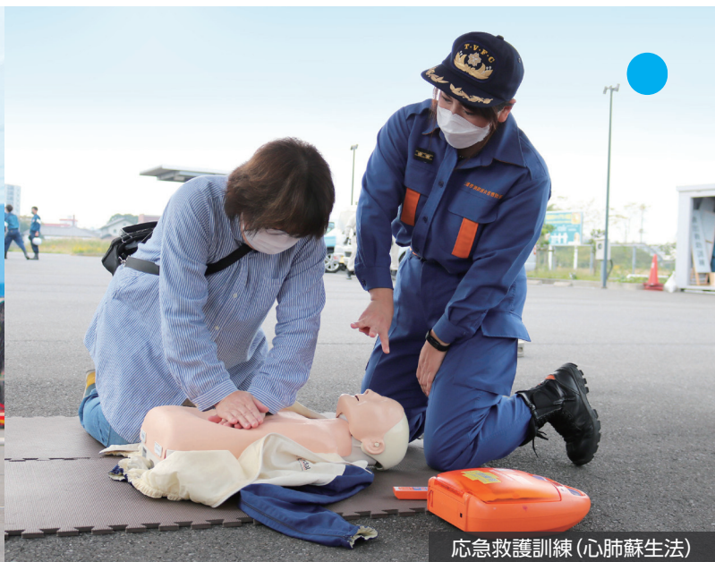
応急救護訓練(心肺蘇生法)