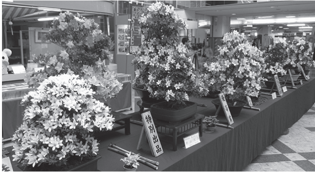
土浦皐月会による作品の展示

日時 5月26日(金)～29日(月) 午前10時～午後5時(最終日は午後3時まで) 場所 エコス新治店 センターコート(大畑) (旧さん・あびお センターコート) 内容 サツキ・山野草・草物盆栽・鉢の販売、土浦皐月会による作品の展示 など 問合せ 土浦市観光協会(☎824-2810)