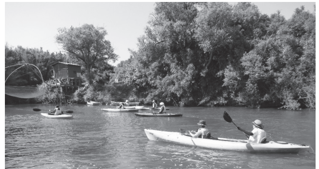
カヌーで桜川の川下り