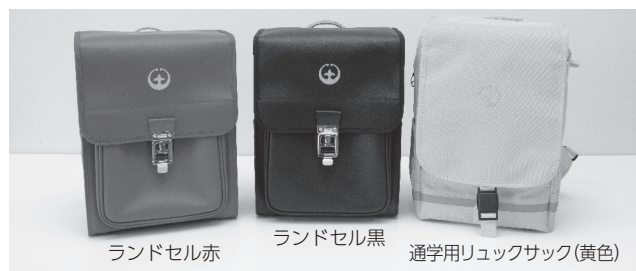
入学祝い品のランドセル