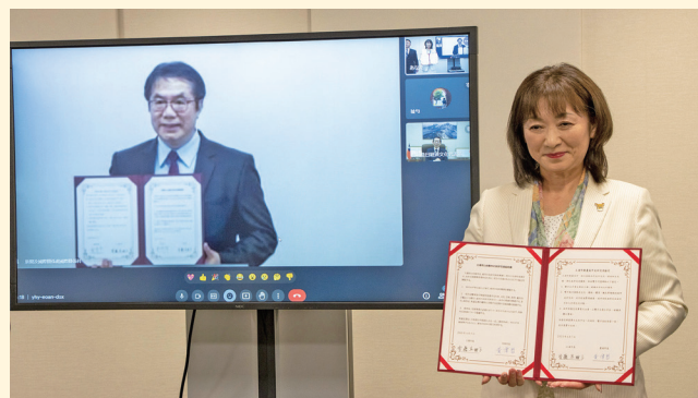
台南市の黄偉哲市長と安藤市長