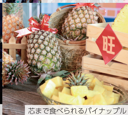
芯まで食べられるパイナップル