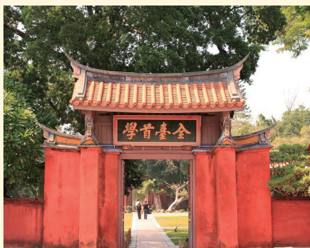
台湾の学問発祥の地「台南孔子廟」