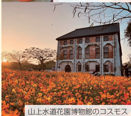
山上水道花園博物館のコスモス