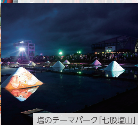
塩のテーマパーク「七股塩山」