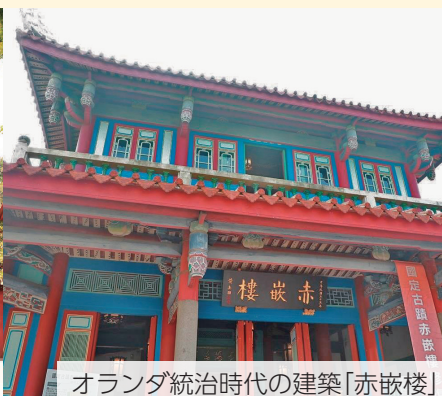
オランダ統治時代の建築「赤嵌楼」