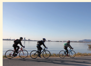
つくば霞ヶ浦りんりんロード