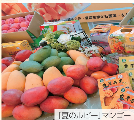
「夏のルビー」マンゴー