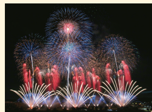
土浦全国花火競技大会