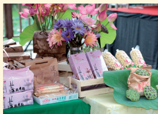
名産れんこんの加工品