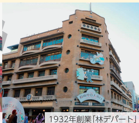
1932年創業「林デパート」