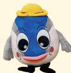
台南市観光PRキャラクター 「魚頭君」