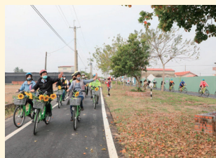
花現東山サイクリングロード