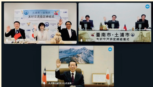
オンライン中継での協定式