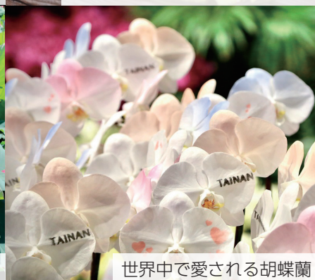
世界中で愛される胡蝶蘭