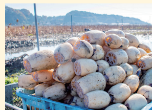
生産量日本一のれんこん