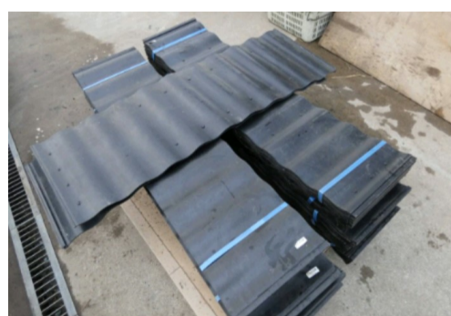
畦板・畦波シート