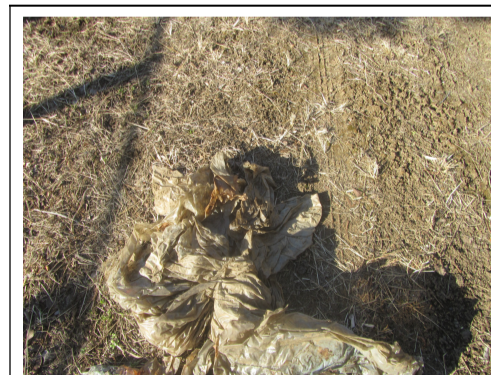
ヤケが激しいビニール・ポリエチレン