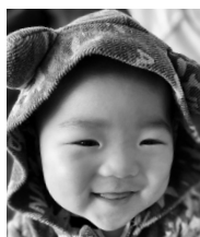
♡祝♡1歳♡ まじかわちい天使♡ 大きなあね♡らぶ