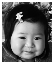
♡しびび♡ いっぱい笑って かわいく元気に育ってね♡