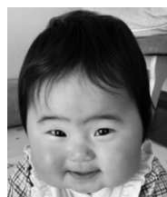
祝1歳♡ まんまるほっぺの 笑顔が大好きだよ！