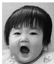
☆1歳おめでとう☆ ステキな笑顔で 元気に育ってね！