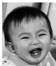
大好きなさく♡ 沢山の笑顔を いつもありがとう♡