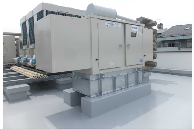
屋上に新設された非常用発電設備