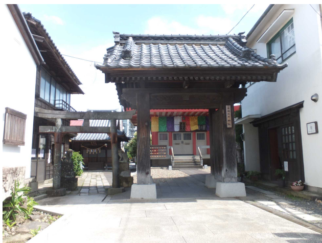
写真1 不動院入口（鳥居の左が「琴平神社々務所」）

現在、不動院境内の入口左側に建つ「琴平神社々務所」の西側と中城天満宮の正面には、江戸時代につくられたという伝承を持つコンクリート製の井戸が残り、「鑿井図」に描かれた井戸を彷彿とさせます。（関口 満）