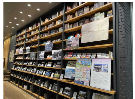
未来屋書店土浦店での写真展の様子