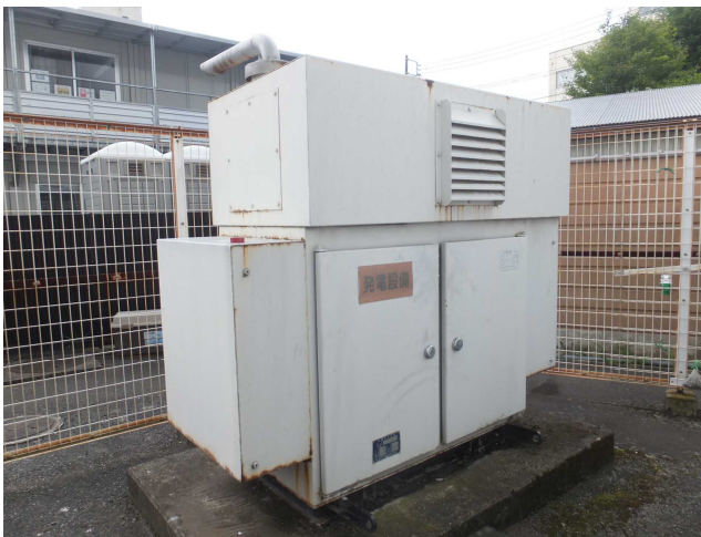
地上に設置されている既存の非常用発電設備

博物館は、市の洪水ハザードマップで3～5mの浸水想定区域にあたります。そこで、既存の非常用発電設備の水没に備え、新たに博物館屋上へ容量の大きな同設備を設置しました。