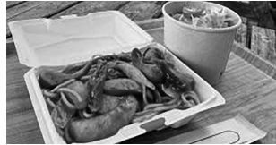
テイクアウトのナポリタン