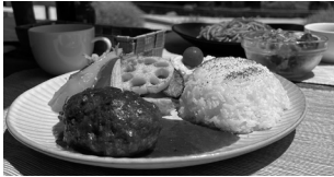
ハンバーグワンプレートランチ