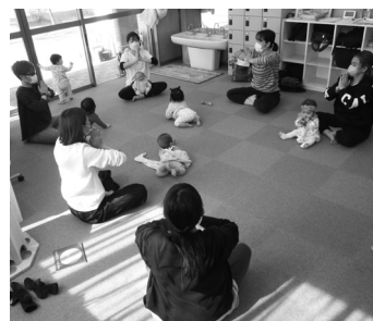
ベビーマッサージ講習会