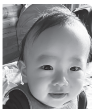
祝1歳 生まれてきてくれてありがとう 毎日幸せです♡