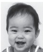
お誕生日おめでとう! 元気に育ってね♪ 大好きだよ