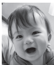
祝1歳☆ 毎日の癒やしをありがとう♡ 大好きだよ♡