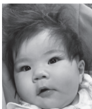
1歳おめでとう ほーちゃんのあくんと仲良く育ってね