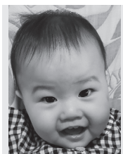
祝☆1歳☆ 沢山笑って 元気に大きくなーれ!