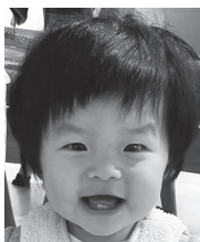
1歳おめでとう♡ これからも 元気に育ってね!