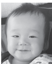
生まれてきてくれて ありがとう! 兄ちゃんと仲良くね