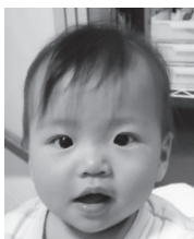
たくさん笑って 楽しく過ごそうね♪ さくら大好き♡