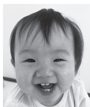
1歳おめでとう♡ いっぱい笑って 元氣に育ってね!