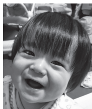
☆祝1歳☆ ねえねと仲良く 笑って元気に育ってね