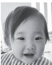
いつも幸せを ありがとう♡ 元氣いっぱい育ってね♪