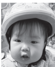
食べっぷりのよさと 笑顔が最高☆ 家族の癒やしです♡