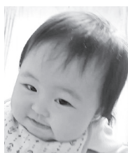
祝☆ハビおめ推しの子みおたん♡癒されMAX♪