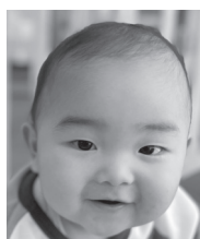
1歳おめでとうこれからも元気にすくすく育ってね！