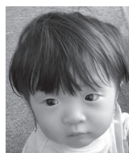
一生推しです父母兄より