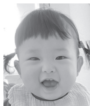
毎日幸せをありがとう♡めいは何より大切な存在だよ