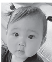
祝☆1歳愛嬌たっぷりなこちゃんが大好きだよ♡