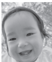
幸せをありがとう♡ニコニコあおくんだーいすき！！