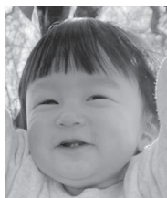
祝1歳☆これからもねえねと仲良くね♡大好き♡