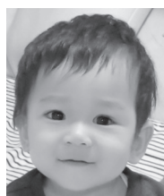
祝☆1歳すくすく育ってね素敵な1年にしようね！