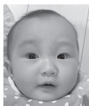
祝1歳♡元気で健康に育ちますように！