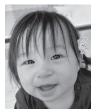
祝1歳！生まれてきてくれてありがとう♪