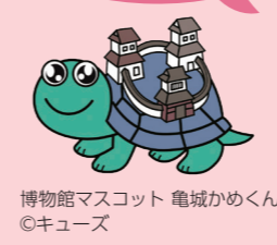
博物館マスコット 亀城かめくん