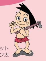
上高津貝塚マスコット モン太

開館時間 午前9時～午後4時30分 休館日 毎週月曜日(4月29日・5月6日を除く) 4月30日(火)、5月7日(火)