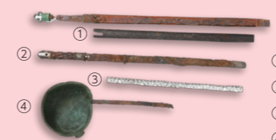
①銅装三累環頭太刀 ②銀装圭頭太刀 ③銀帯状金具 ④鉄柄銅鈎